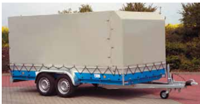
MZ 2702 mit Zubehör: Aluminium-Auffahrrampen, Bordwände Aluminium 200 mm hoch, Dachgestell und PVC-Plane, Ladehöhe 1600 mm, windschnittig vorne abgelenkt für niedrigen c_w -Wert, Heckklappe aus Aluminium.