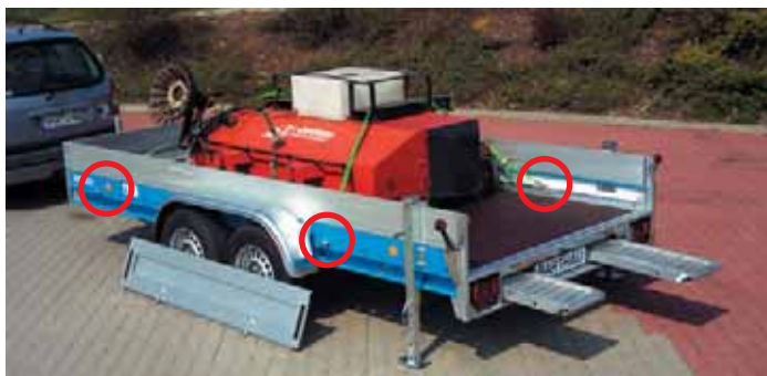
MZ 3502 mit Zubehör: Aluminium-Auffahrrampen, Teleskopstützen, Heckklappe und Aluminium-Bordwände, 200 mm hoch (Gesamthöhe 350 mm).

Nach DIN 75410-1 sind je nach Länge des Fahrzeuges eine ausreichende Anzahl von Zurrpunkten vorgeschrieben. Wir liefern serienmäßig 8 Zurrösen mit. Jeder Anhänger hat insgesamt 22 Zurrpunkte. Es können als Zubehör noch weitere Zurrösen nachbestellt werden.