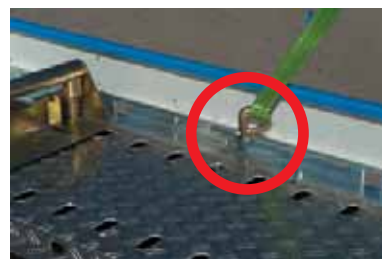
Optimale Verzerrung bei jeder Fahrzeuflänge durch