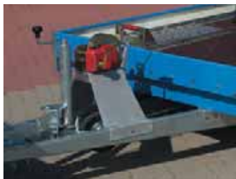
Zubehör: Seilwinde mit Windenbock und Verstellkeil auf Aluminium-Arretierblech.