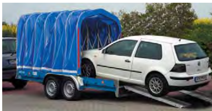
MZ 2702 mit Faltpavillon. Für die Fahrzeugverladung wird der Faltpavillon auf der Führungsschiene ganz nach vorne geschoben. Die Fahrzeugtüre kann geöffnet werden.