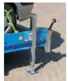
Zubehör: Teleskopstützen , mit Bolzen arretierbar, Feineinstellung mittels Kurbel, Tragkraft 1500 kg.