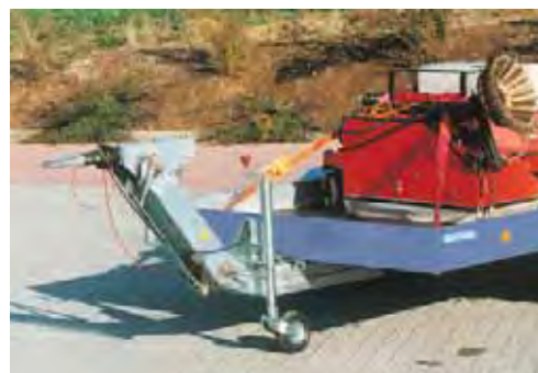
Zubehör: Höhenverstellbare Auflaufbremse, mit DIN-Zugöse, verstellbar von 400 bis 1100 mm Anhängerehöhe.