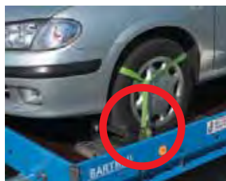
Zubehör: Verstellkeil auf Aluminium-Arretierblech.